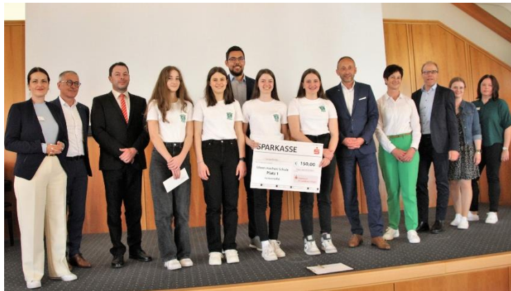
Sieger Juniorstaffel Team „F.E.A.A.“ Ortenburg-Gymnasium Oberviechtach

25. Mai 2023 – Sparkasse im Landkreis Cham