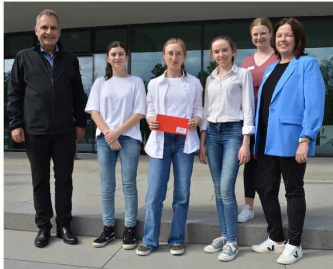
Sieger Seniorstaffel Team „FlowerPlanet“ St. Marien-Gymnasium der Schulstiftung der Diözese Regensburg