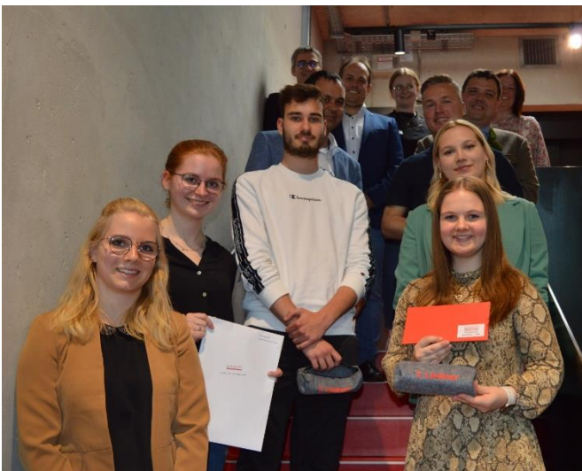
Sieger Seniorstaffel Team „RaR – Rent a Ride“ Staatliche Berufsschule 2 Passau