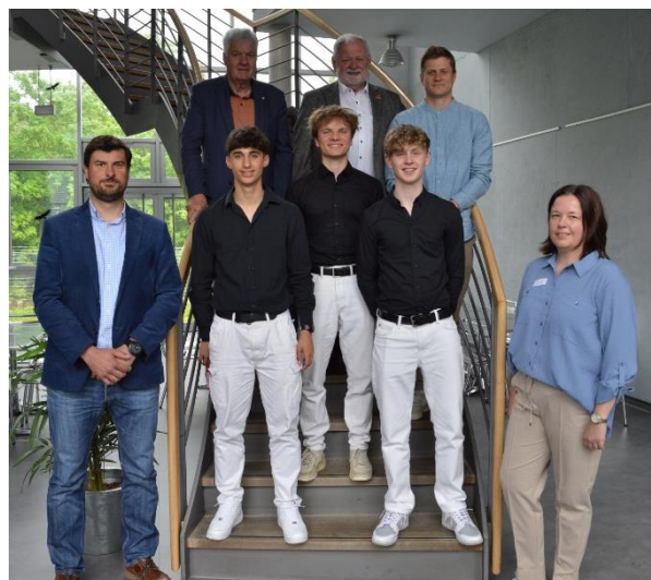
Sieger Seniorstaffel Team „BigFish“ St.-Gotthard-Gymnasium der Benediktiner Niederaltaich