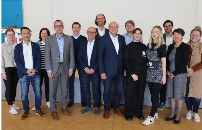
Sieger Juniorstaffel Team „TimeUp“ Gymnasium Seligenthal Landshut