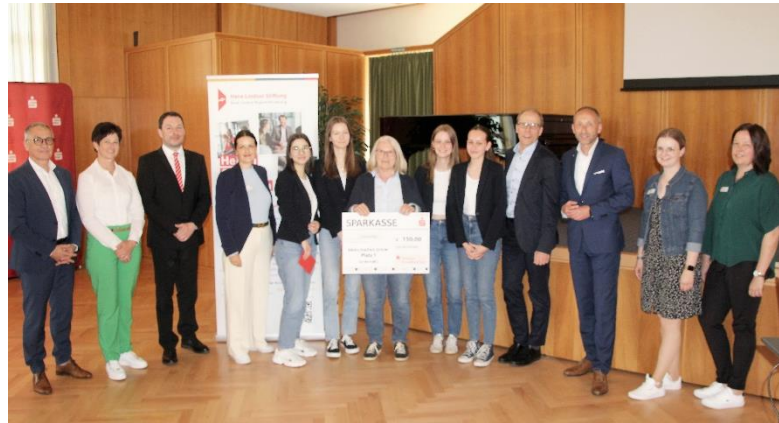
Sieger Seniorstaffel Team „Educlly“ Ortenburg-Gymnasium Oberviechtach