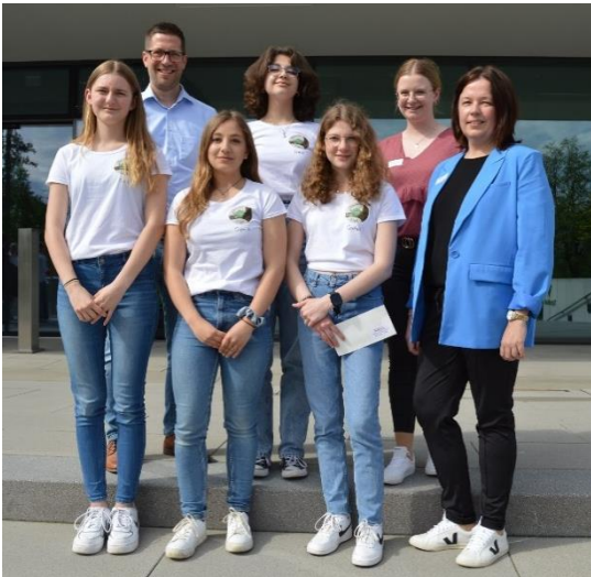
Sieger Juniorstaffel Team „Mates“ Gabelsberger-Gymnasium Mainburg