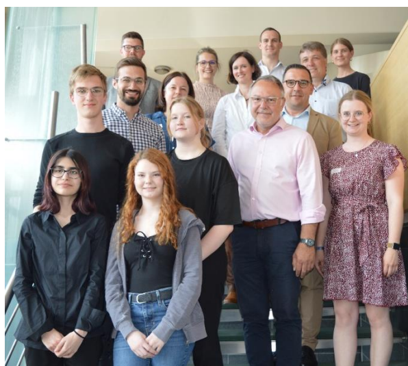
Sieger Seniorstaffel Team „Stitch“ Gymnasium Pfarrkirchen