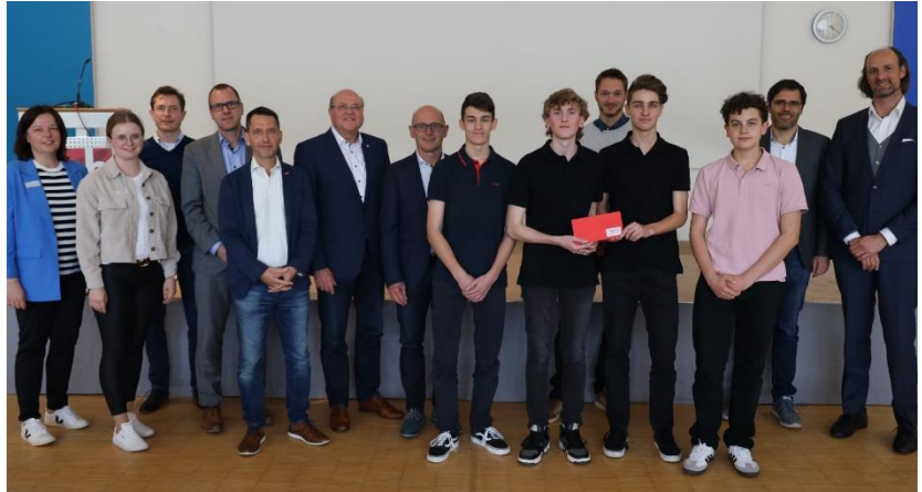
Sieger Seniorstaffel Team „EasyStudying“ Gymnasium Ergolding