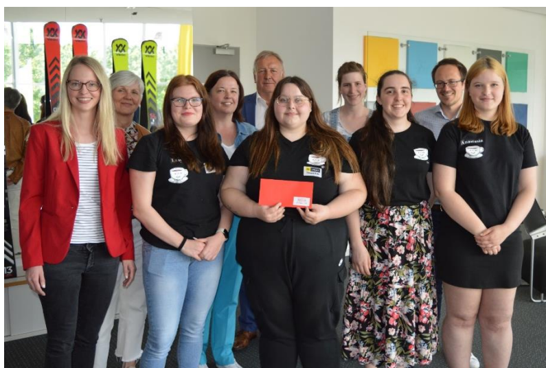
Sieger Seniorstaffel Team „C.E.D.CAFE“ Staatliche Fach- und Berufsoberschule Straubing

23. Mai 2023 – Firma Völkl Sports GmbH & Co. KG