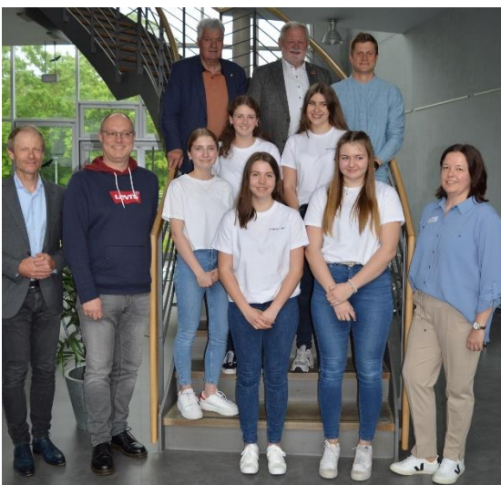
Sieger Juniorstaffel Team „DogSit“ Gymnasium Zwiesel